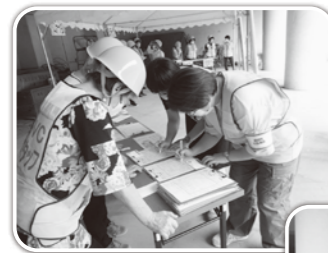
◀ボラ連の方々が訓練に参加