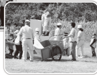
倒壊家屋のがれきの撤去▶