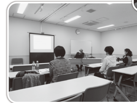
発達障がいに関する講座の様子