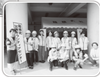
当日参加メンバー▶