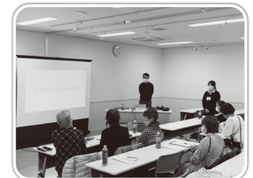
認知症に関して講師に質問中