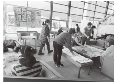
ワークショップの様子